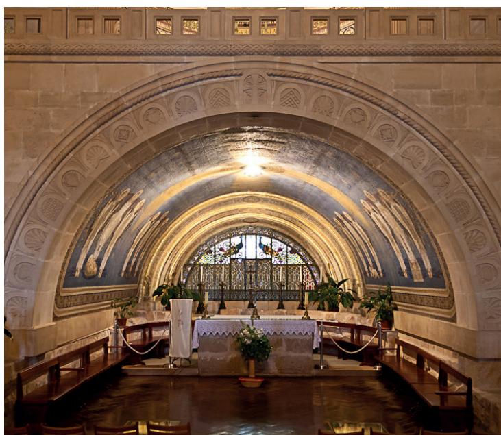
Monte Tabor: Incarnazione / Eucarestia / Morte / Resurrezione

Verso quell'ora di luce e di bellezza siamo tutti in cammino: e invocare l'avvento del Tuo regno ci aiuta a restare vigili nella speranza, a misurare la scena delle cose penultime sulla bellezza promessa dell'ultimo orizzonte, sospirato ed atteso, quello della città celeste.